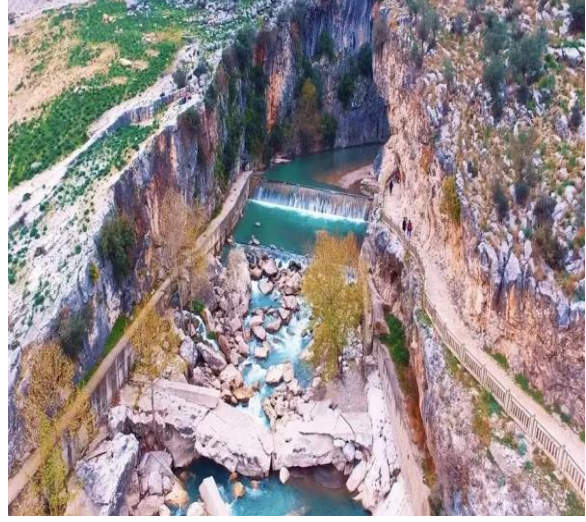
* KAPIKAYA KANYONU