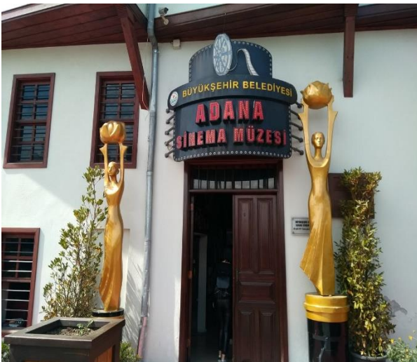
*ADANA SİNEMA MÜZESİ