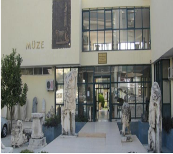
* ADANA ARKEOLOJİ MÜZESİ