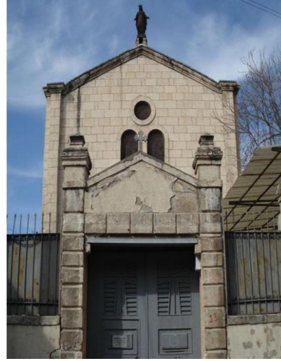
* BEBEKLİ KİLİSESİ

OTELİMİZ ADANA DA BULUNAN TARİHİ YERLERİN TANITIMLARINDA ÖNCÜ BİR ROL OYNAMAKTADIR.