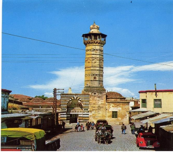
* ADANA ULU CAMİİ